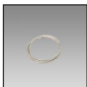
1008.1440 Set di cavi

Set di cavi Solo Slim 5x0.75 mm 2 , trasparente, 5 poli, L = 3200 mm