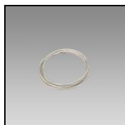
1008.1440 Set de câble

Set de câble Solo Slim 5x0.75 mm 2 , transparent, 5 pôles, L = 3200 mm