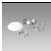
1000.3196 Set de montage

Joint d'étanchéité Solo 500, silicone, blanc, degré de protection IP20 / IP44