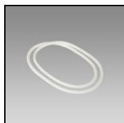
1000.2887 Joint d'étanchéité

Set de montage Solo pour montage suspension, 3 points fil suspension L = 3000 mm