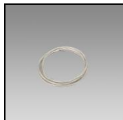
1008.1445 Set de câble

Set de câble Solo Slim 5x0.75 mm 2 , transparent, 5 pôles, L = 3200 mm