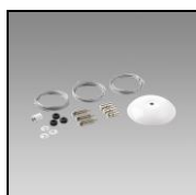
1000.3193 Set de montage

Set de câble Solo Slim 3x0.75 mm 2 , transparent, 3 pôles, L = 3200 mm