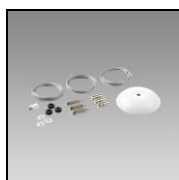
1000.3193 Set de montage

Set de câble Solo Slim 3x0.75 mm 2 , transparent, 3 pôles, L = 3200 mm