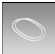
1000.2888 Joint d'étanchéité

Set de montage Solo pour montage suspension, 3 points fil suspension L = 3000 mm