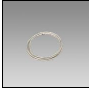
1008.1445 Set de câble

Set de câble Solo Slim 5x0.75 mm 2 , transparent, 5 pôles, L = 3200 mm