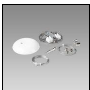
1000.3196 Set de montage

Set de montage Solo pour montage suspension, 3 points fil suspension L = 3000 mm