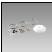
1000.3193 Set de montage

Set de câble Solo Slim 3x0.75 mm 2 , transparent, 3 pôles, L = 3200 mm