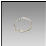
1008.1440 Set de câble

Set de câble Solo Slim 5x0.75 mm 2 , transparent, 5 pôles, L = 3200 mm