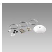
1000.3193 Set di montaggio

Set di cavi Solo Slim 3x0.75 mm 2 , trasparente, 3 poli, L = 3200 mm