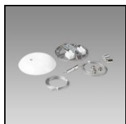
1000.3196 Set di montaggio

Set di montaggio Solo per montaggio a sospensione, cavo di sospensione a 3 punti L = 3000 mm