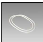
1000.2888 Joint d'étanchéité

Set de montage Solo pour montage suspension, 3 points fil suspension L = 3000 mm