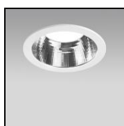
2006.4286 Anneau de couverture

degré de protection IP55, Ø = 198 mm, lø = 153 mm