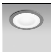
2006.4283 Anneau de couverture

Boîtier d'encastrement B.Box en matière synthétique, rond, ø ouverture = 175 mm, EL = 385 mm, EB = 310 mm, ET = 160 mm