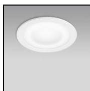
2006.4284 Anneau de couverture

degré de protection IP55, Ø = 198 mm, lø = 153 mm