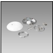
1000.3196 Set de montage

Set de montage Solo pour montage suspension, 3 points fil suspension L = 3000 mm