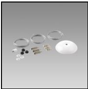
1000.3193 Set de montage

Set de câble Solo Slim 5x0.75 mm 2 , transparent, 5 pôles, L = 3200 mm