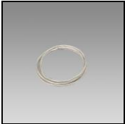
1008.1445 Set de câble

Set de câble Solo Slim 5x0.75 mm 2 , transparent, 5 pôles, L = 3200 mm