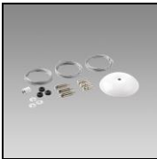
1000.3193 Set di montaggio

Set di cavi Solo Slim 5x0.75 mm 2 , trasparente, 5 poli, L = 3200 mm