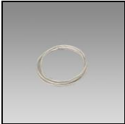
1008.1445 Set di cavi

Set di cavi Solo Slim 5x0.75 mm 2 , trasparente, 5 poli, L = 3200 mm