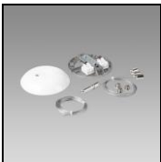
1000.3196 Set di montaggio

Set di montaggio Solo per montaggio a sospensione, cavo di sospensione a 3 punti L = 3000 mm