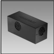
2004.4914 Module de communication

TWEAK2 ESS S1U1950 LED9400-840 SR 0IFSEDI CH