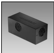
2004.4914 Modulo di comunicazione

TWEAK2 ESS S1U1950 LED9400-840 SR 0IFSEDI CH