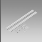
1021.8418 Set angulaire

Set angulaire Item LED, pour montage dans des faux-plafonds