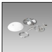
1000.3196 Set de montage

Set de montage Solo pour montage suspension, 3 points fil suspension L = 3000 mm