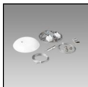
1000.3196 Set di montaggio

Set di montaggio Solo per montaggio a sospensione, cavo di sospensione a 3 punti L = 3000 mm