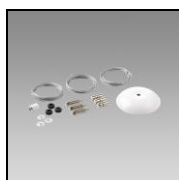
1000.3193 Set di montaggio

Set di cavi Solo Slim 3x0.75 mm 2 , trasparente, 3 poli, L = 3200 mm