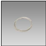
1008.1440 Set de câble

Set de câble Solo Slim 5x0.75 mm 2 , transparent, 5 pôles, L = 3200 mm