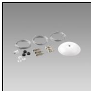
1000.3193 Set de montage

Set de câble Solo Slim 3x0.75 mm 2 , transparent, 3 pôles, L = 3200 mm