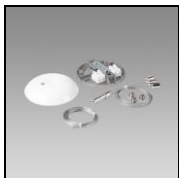
1000.3196 Set de montage

Joint d'étanchéité Solo 500, silicone, blanc, degré de protection IP20 / IP44