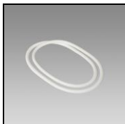
1000.2887 Joint d'étanchéité

Set de montage Solo pour montage suspension, 3 points fil suspension L = 3000 mm