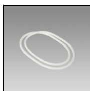
1000.2887 Joint d'étanchéité

Set de montage Solo pour montage suspension, 3 points fil suspension L = 3000 mm