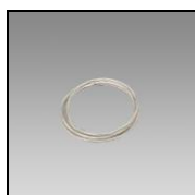
1008.1440 Set de câble

Set de câble Solo Slim 5x0.75 mm 2 , transparent, 5 pôles, L = 3200 mm