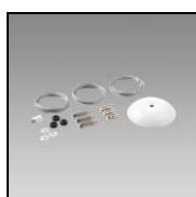
1000.3193 Set de montage

Set de câble Solo Slim 3x0.75 mm 2 , transparent, 3 pôles, L = 3200 mm