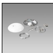
1000.3196 Set de montage

Joint d'étanchéité Solo 500, silicone, blanc, degré de protection IP20 / IP44