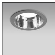
2006.4285 Anneau de couverture

degré de protection IP55, Ø = 198 mm, lø = 153 mm