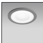
2006.4283 Anneau de couverture

Boîtier d'encastrement B.Box en matière synthétique, rond, ø ouverture = 175 mm, EL = 385 mm, EB = 310 mm, ET = 160 mm