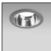
2006.4287 Anneau de couverture

degré de protection IP55, Ø = 198 mm, lø = 153 mm