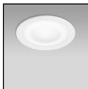
2006.4284 Anneau de couverture

degré de protection IP55, Ø = 198 mm, lø = 153 mm