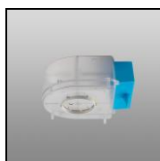
2000.9153 Boîtier d'encastrement

Anneau porteur pour renforcement du plafond Echo 172 en MDF, pour épaisseurs de plafond < 3 mm Ø = 252 mm, lø = 172 mm, H = 8 mm