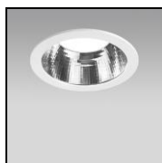
2006.4286 Anneau de couverture

degré de protection IP55, Ø = 198 mm, lø = 153 mm