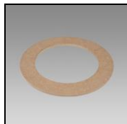
1023.4534 Anneau porteur pour renforcement du plafond

Anneau porteur pour renforcement du plafond Echo 172 en MDF, pour épaisseurs de plafond < 3 mm Ø = 252 mm, lø = 172 mm, H = 8 mm