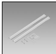
1021.8418 Set angulaire

Set angulaire Item LED, pour montage dans des faux-plafonds