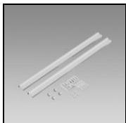
1021.8418 Set angulaire

Set angulaire Item LED, pour montage dans des faux-plafonds