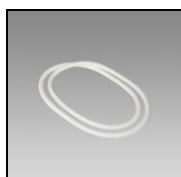
1000.2887 Joint d'étanchéité

Set de montage Solo pour montage suspension, 3 points fil suspension L = 3000 mm