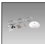
1000.3193 Set de montage

Set de câble Solo Slim 3x0.75 mm 2 , transparent, 3 pôles, L = 3200 mm