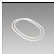
1000.2886 Joint d'étanchéité

Set de montage Solo pour montage suspension, 3 points fil suspension L = 3000 mm