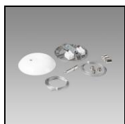
1000.3196 Set de montage

Joint d'étanchéité Solo 400, silicone, blanc, degré de protection IP20 / IP44