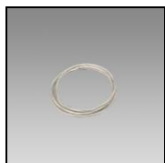
1008.1440 Set de câble

Set de câble Solo Slim 5x0.75 mm 2 , transparent, 5 pôles, L = 3200 mm