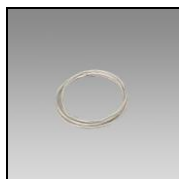
1008.1440 Set di cavi

Set di cavi Solo Slim 5x0.75 mm 2 , trasparente, 5 poli, L = 3200 mm