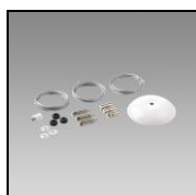
1000.3193 Set di montaggio

Set di cavi Solo Slim 3x0.75 mm 2 , trasparente, 3 poli, L = 3200 mm