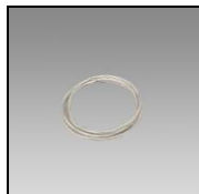
1008.1445 Set di cavi

Set di cavi Solo Slim 5x0.75 mm 2 , trasparente, 5 poli, L = 3200 mm