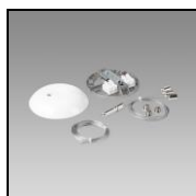
1000.3196 Set di montaggio

Guarnizione Solo 400, silicone, bianco, grado di protezione IP20 / IP44