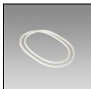
1000.2887 Joint d'étanchéité

Set de montage Solo pour montage suspension, 3 points fil suspension L = 3000 mm