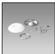
1000.3196 Set di montaggio

Guarnizione Solo 500, silicone, bianco, grado di protezione IP20 / IP44