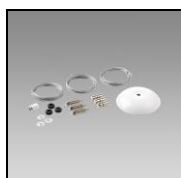
1000.3193 Set di montaggio

Set di cavi Solo Slim 3x0.75 mm 2 , trasparente, 3 poli, L = 3200 mm