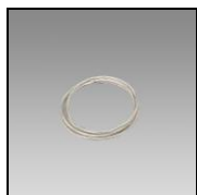
1008.1440 Set di cavi

Set di cavi Solo Slim 5x0.75 mm 2 , trasparente, 5 poli, L = 3200 mm