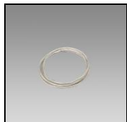
1008.1445 Set di cavi

Set di cavi Solo Slim 5x0.75 mm 2 , trasparente, 5 poli, L = 3200 mm