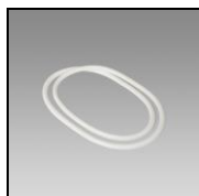
1000.2888 Joint d'étanchéité

Set de montage Solo pour montage suspension, 3 points fil suspension L = 3000 mm