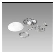
1000.3196 Set de montage

Set de montage Solo pour montage suspension, 3 points fil suspension L = 3000 mm