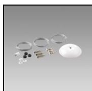
1000.3193 Set de montage

Set de câble Solo Slim 3x0.75 mm 2 , transparent, 3 pôles, L = 3200 mm