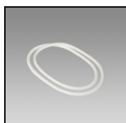
1000.2886 Joint d'étanchéité

Set de montage Solo pour montage suspension, 3 points fil suspension L = 3000 mm