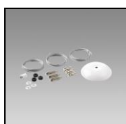
1000.3193 Set de montage

Set de câble Solo Slim 3x0.75 mm 2 , transparent, 3 pôles, L = 3200 mm