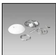
1000.3196 Set de montage

Joint d'étanchéité Solo 400, silicone, blanc, degré de protection IP20 / IP44