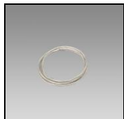
1008.1445 Set de câble

Set de câble Solo Slim 5x0.75 mm 2 , transparent, 5 pôles, L = 3200 mm