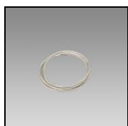
1008.1440 Set de câble

Set de câble Solo Slim 5x0.75 mm 2 , transparent, 5 pôles, L = 3200 mm