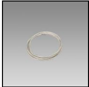
1008.1445 Set de câble

Set de câble Solo Slim 5x0.75 mm 2 , transparent, 5 pôles, L = 3200 mm