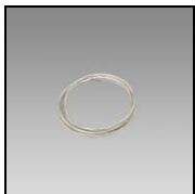
1008.1440 Set de câble

Set de câble Solo Slim 5x0.75 mm 2 , transparent, 5 pôles, L = 3200 mm