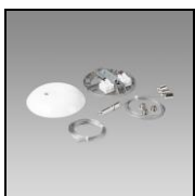
1000.3196 Set de montage

Joint d'étanchéité Solo 650, silicone, blanc, degré de protection IP20 / IP44