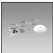
1000.3193 Set de montage

Set de câble Solo Slim 3x0.75 mm 2 , transparent, 3 pôles, L = 3200 mm