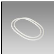
1000.2888 Joint d'étanchéité

Set de montage Solo pour montage suspension, 3 points fil suspension L = 3000 mm