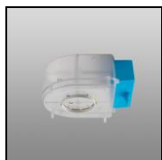
2000.9153 Boîtier d'encastrement

Anneau porteur pour renforcement du plafond Echo 172 en MDF, pour épaisseurs de plafond < 3 mm Ø = 252 mm, lØ = 172 mm, H = 8 mm