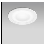
2006.4284 Anneau de couverture

degré de protection IP55, Ø = 198 mm, lØ = 153 mm