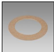
1023.4534 Anneau porteur pour renforcement du plafond

Anneau porteur pour renforcement du plafond Echo 172 en MDF, pour épaisseurs de plafond < 3 mm Ø = 252 mm, lØ = 172 mm, H = 8 mm