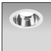
2006.4286 Anneau de couverture

degré de protection IP55, Ø = 198 mm, lØ = 153 mm