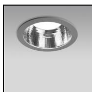
2006.4287 Anneau de couverture

degré de protection IP55, Ø = 198 mm, lØ = 153 mm