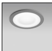
2006.4283 Anneau de couverture

Boîtier d'encastrement B.Box en matière synthétique, rond, Ø ouverture = 175 mm, EL = 385 mm, EB = 310 mm, ET = 160 mm