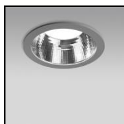
2006.4285 Anneau de couverture

degré de protection IP55, Ø = 198 mm, lØ = 153 mm