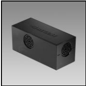
2004.4914 Modulo di comunicazione

TWEAK2 ESS S1U1950 LED9400-840 SR IF1CSEDI CH